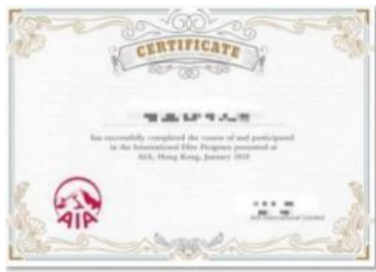
香港实习证明(样例)