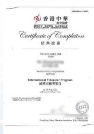
国际志愿者证明(样例)