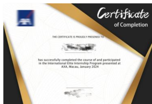
澳门实习证明(样例)