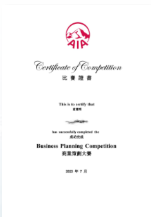
商赛策划大赛证书(样例)