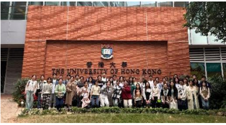
参访交流：香港大学