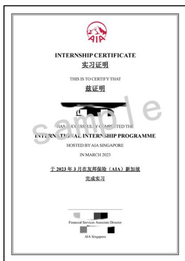
项目结业证书（样例）