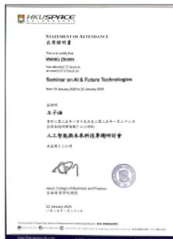
项目结业证书&学时证明信（样例）