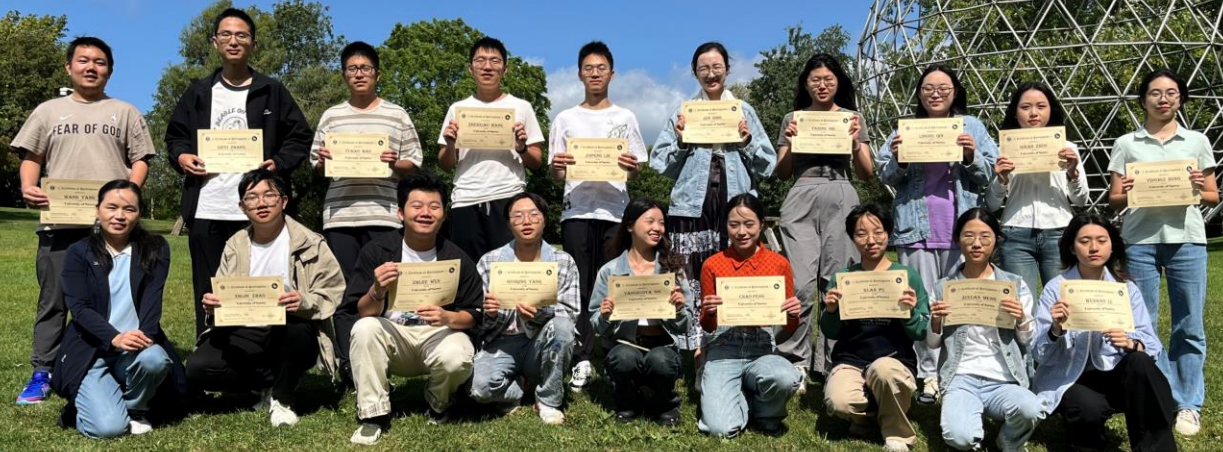
Photo of 2024 summer school

FACULTY OF ENGINEERING AND PHYSICAL SCIENCES UNIVERSITY OF SURREY